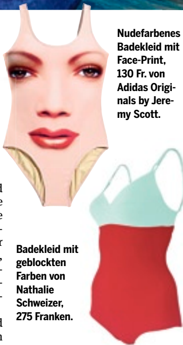
Nudefarbenes Badekleid mit Face-Print, 130 Fr. von Adidas Originals by Jeremy Scott.

Bikinis und Badeanzüge im Marine-Look – etwa mit Streifenmuster wie bei Tommy Hilfinger – waren zudem auch ein Thema bei der diesjährigen Mercedes-Benz Fashion Week Swim in Miami. Neben